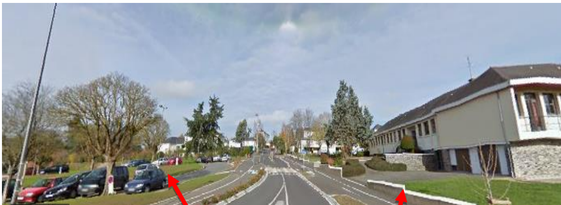
Parking municipal pour les stagiaires

Chacun doit veiller au respect des règles de sécurité et d'accessibilité des voies de circulation.