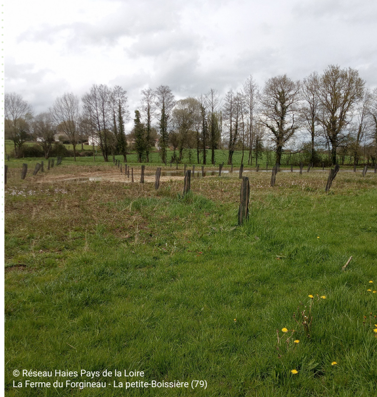
La Ferme du Forgiveau - La petite-Boissière (79)

Assistante formation : Aurélie YVINEC - T. 02 41 68 60 00 aurelie.yvynec@educagri.fr